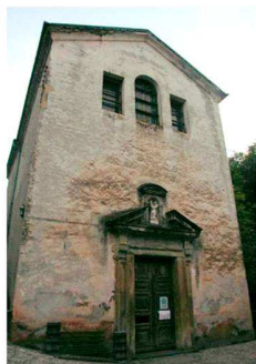
Ex Oratorio della Madonna del Fiume (detto di Garelo) a Pello Inferiore (Comune di Alta Valle Intelvi)

DOMENICA 13 AGOSTO - Pello - Oratorio di S.Maria del Fiume APPACuVI suggerisce di visitare dalle ore 15,00-la bella Chiesa restaurata a cura di APPACuVI e sua storica Sede.